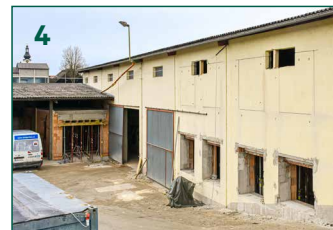
Bild 1: Gewerbecenter vor dem Umbau Bild 2: Aktueller Stand mit neuer Verglasung Bild 3: In Arbeit: Die künftige Zimmerei-Halle Bild 4: Der Rohbau der Malerei-Halle ist fertig